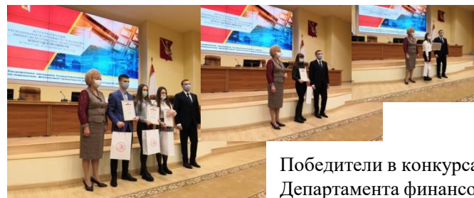
Победители в конкурсах Департамента финансов