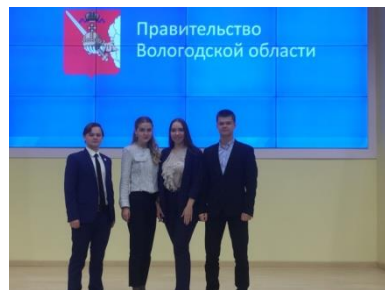
Победители ежегодного областного конкурса научных проектов «Моя стратегия – моё будущее»