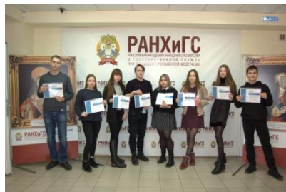
Призеры Всероссийского диктанта по английскому языку