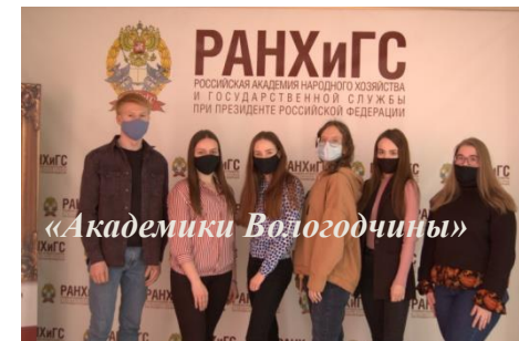
Всероссийский чемпионат по финансовой грамотности