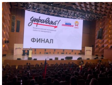
Победители Всероссийского молодежного Кубка по менеджменту «Управляй!»